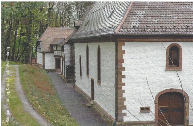
Abb. 8: Kolmerbergkapelle: Mit der Natursteinschlämme konnten die unterschiedlichen Putzbereiche in ein harmonisches Gesamtbild überführt werden.

Eine Natursteinschlämme auf Basis von natürlich hydraulischem Kalk ist in der Regel besser auf eine etwas geringere Festigkeit des Untergrunds eingestellt als eine Trass-Kalk-Natursteinschlämme. Damit eignete sie sich gut als Schlämme für die weicheren historischen Kalkputze, wie sie an der katholischen Kirche in Dernbach und der Kolmerbergkapelle zu finden waren. Die Abstimmung zwischen Putz und Schlämme minimiert Spannungen, wie sie durch thermische Reaktionen auf Temperaturwechsel und Frost hervorgerufen werden. Für Natursteinschlämmen gilt ein guter Haftverbund als entscheidendes Erfolgskriterium. Nur dann kann die Schlämme in dünnen Schichten aufgetragen werden, sodass die Struktur des Untergrunds durchscheint und dennoch der Putz und das Mauerwerk vor einem direkten Schlagregenbefall und zu viel eindringender Feuchtigkeit geschützt werden. Gleichzeitig ist die Schlämme diffusionsfähig und transportiert Feuchtigkeit wieder nach außen ab.