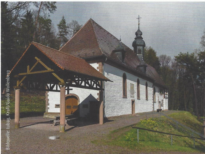
Abb. 2: Die im 15. Jahrhundert entstandene und jetzt sanierte Kolmerbergkapelle ist eine der bekanntesten Wallfahrtsstätten der Südpfalz.