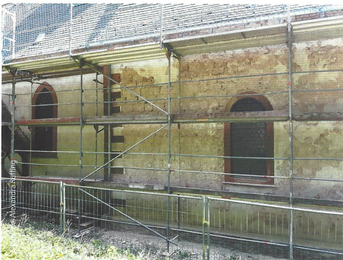
Abb. 6: Kolmerbergkapelle: Manche Bereiche erforderten eine großflächige Erneuerung.