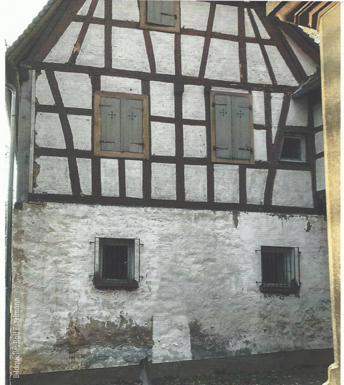
Abb. 3: Bei der Kolmerbergkapelle zeigte das Fachwerk der rückseitigen Giebelwand Zersetzungserscheinungen, nicht zuletzt durch Käferbefall.