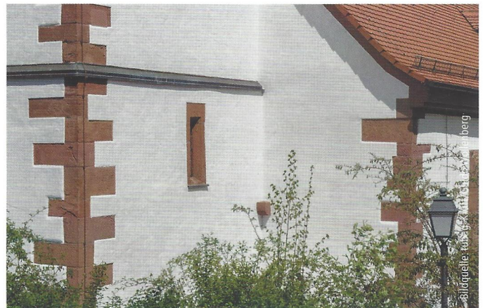
Abb. 9: Kirche Dernbach: Die Natursteinschlämme NHL-NS auf Basis von natürlich hydraulischem Kalk ist optimal auf historische Kalkputze eingestellt. Vor dem Schlämmen wurden die schadhaften Stellen mit einem zweilagig aufgetragenen NHL-Putz verputzt.

Beide Gebäude bekamen abschließend einen Sumpfkalkanstrich in einer leuchtend weißen Farbgebung, der bei der Kapelle freskal (nass in nass) auf die oberste Schlämmschicht aufgebracht wurde.