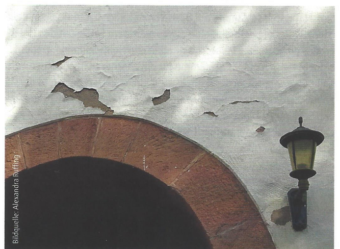
Abb. 7: Kirche Dernbach: Alle losen Stellen wurden vor dem neuen Putzauftrag sorgfältig abgeklopft.

Die Außenwände der Kapelle bekleidete ein Kalkputz. Obwohl an einigen Bereichen teils großflächige Schäden auftraten, war er an anderen Stellen noch funktionstüchtig. Die neu aufgebaute und noch unverputzte Giebelwand an der Rückseite der Kapelle sollte im Zuge der Maßnahmen ebenfalls stimmig in das Gesamtbild integriert werden. Sowohl an der Kirche als auch an der Kapelle war der Putz an einigen Stellen komplett abgeplatzt oder abgeblättert (Abb. 5/6). Um diese Stellen herum zeigten die geschädigten Flächen weitere Risse und Hohlstellen, sodass hier kein direkter Verbund zwischen Mauerwerk und Putz mehr bestand. Alle diese losen Stellen wurden sorgfältig lokalisiert und abgeklopft (Abb. 7).