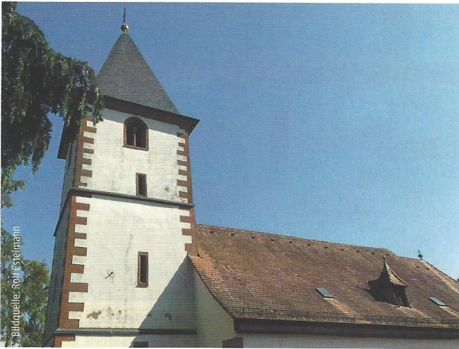
Abb. 4: Neben Kirchturm und Dach erforderte auch der Außenputz der Kirche Dernbach Instandsetzungsmaßnahmen.